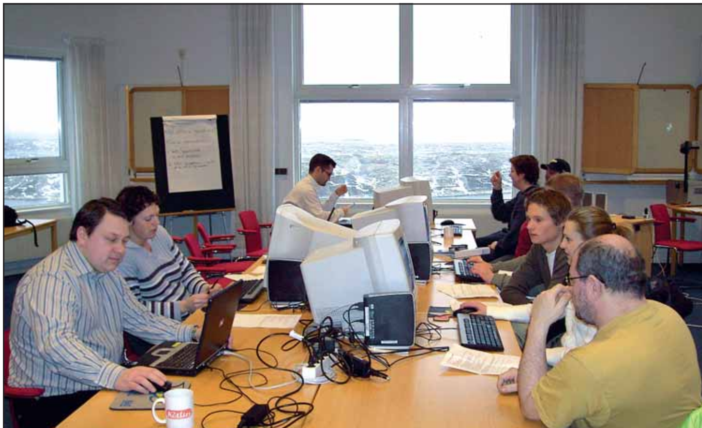
Kompetenskartläggning på Abba Seafood.