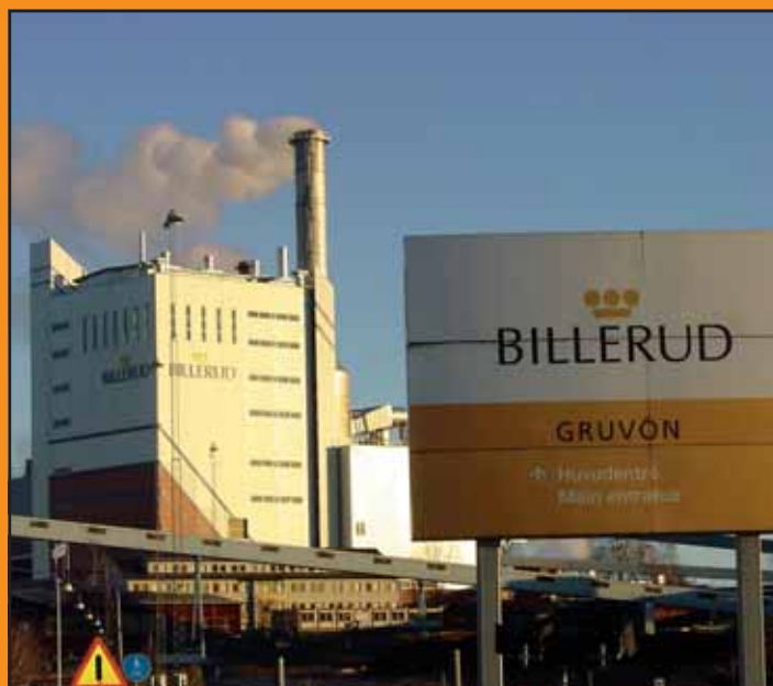
Billerud AB Gruvöns Bruk är en av världens ledande tillverkare av papper till förpackningar. På Gruvön satsar man mycket på kompetensutveckling för att bygga vidare på den kunskap som finns och vidareutveckla sina medarbetare.